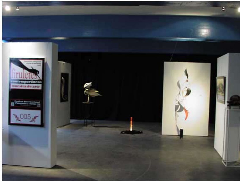
Firuletes Contemporáneos 005 / arte contemporáneo 4 Festival Internacional Patagonia y Tango / 2 Encuentro Patagónico El Arte en Bariloche