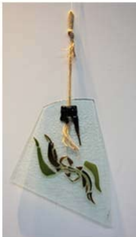
Lelia Martínez; "Firulete de botella"; vitrofundición y cairel; 2005