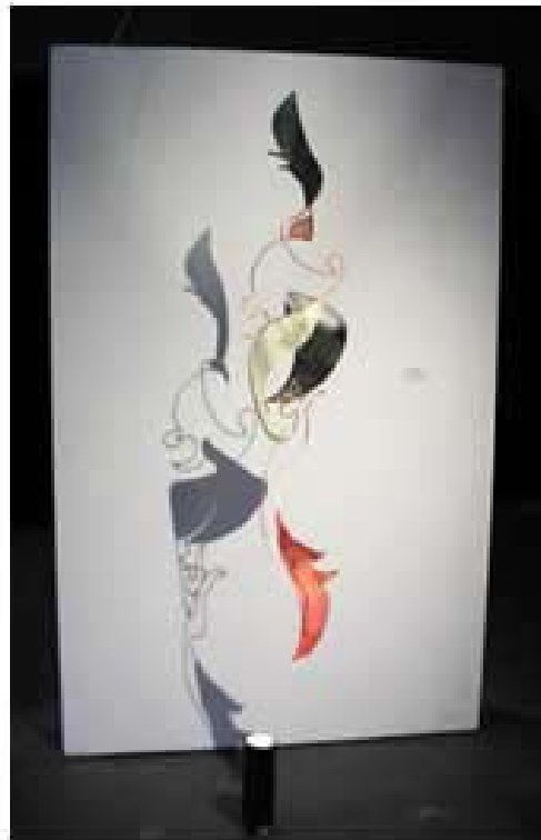
Alicia Milstein; (s / t); papel hecho a mano, alambre, motor, luz; 2005