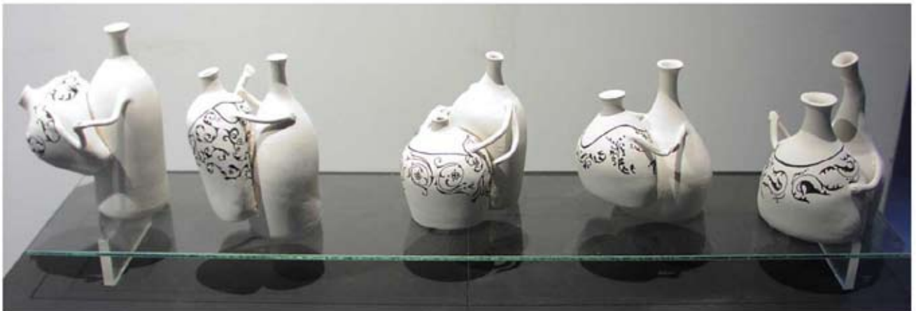
Gaby Larrea; ( s / t ), cerámica; 2005