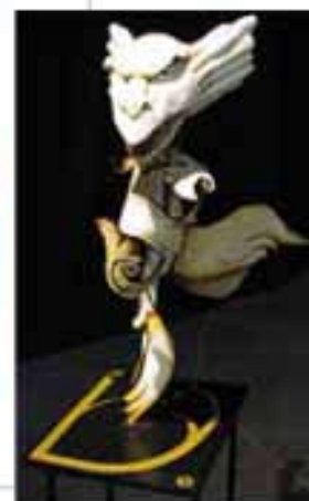
Vanessa Dee; "Fuerza"; bajorelieve con espejo y escultura en papel maché, madera y alambre, 2005