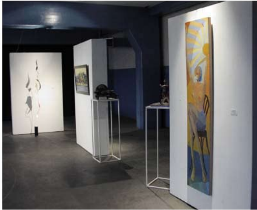
Roxana Jacob; "Perfume de naranjo en flor"; óleo sobre madera; 2005 en el primer plano de una vista parcial de la sala