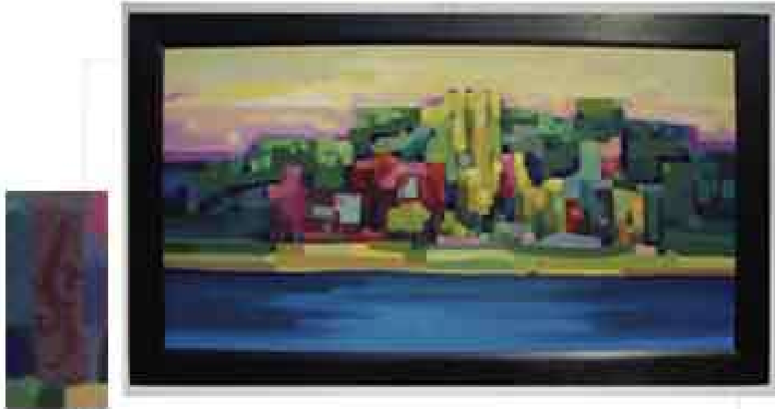
Maria del Rosario Rincón; "Formas"; óleo; 2005