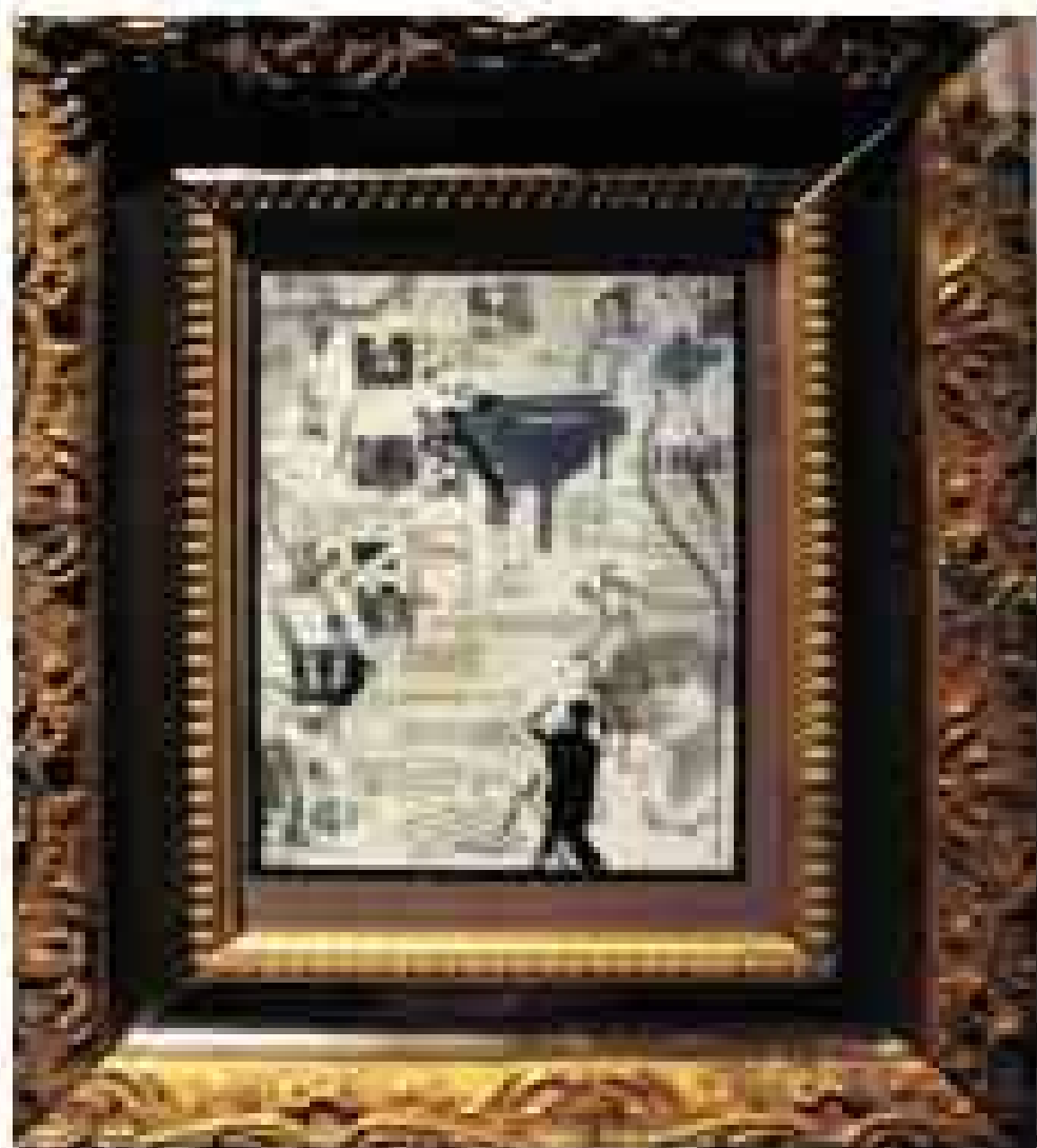
Jorge Piccini; (s / t); imagen digital