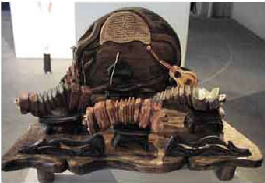
Rubén Rodríguez: "Pequeña Orquesta": talla en madera; 2005