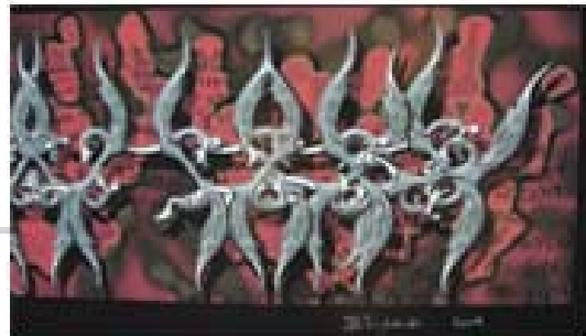
Ingrid Roddick; "El firulete"; impreso digital; 2005