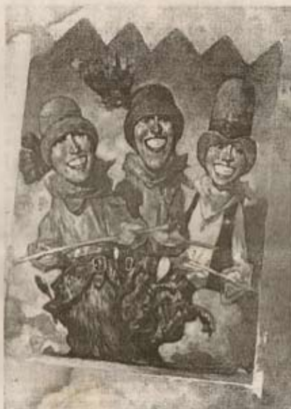
■ Una de las ilustraciones de tapa de los catálogos de Nine.

Pero la concurrencia en los próximos días de Carlos Nine se torna en un hecho relevante que